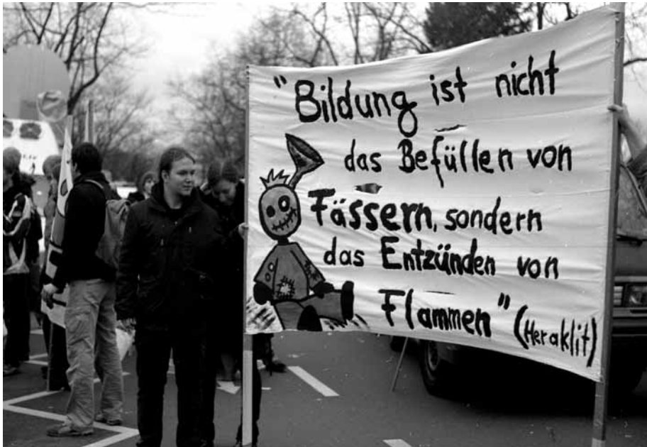
„Kultusminister nachsitzen“ - Demonstration 2009