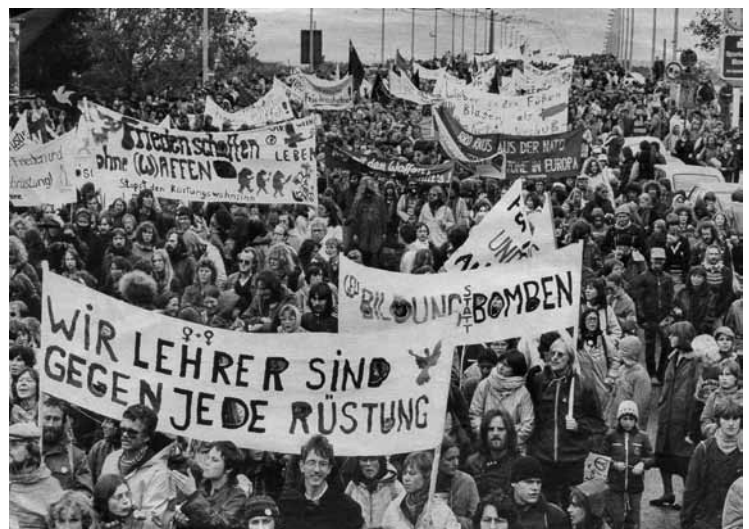
Friedensdemonstration 1982 in Bonn