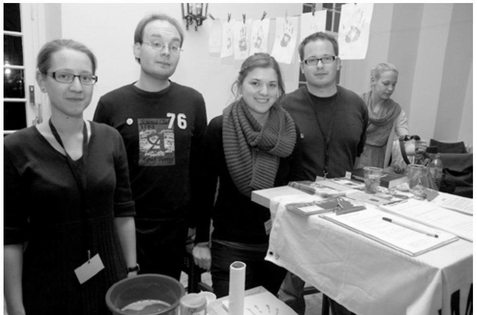
Mitglieder*innen der Amnesty-HSG Bonn