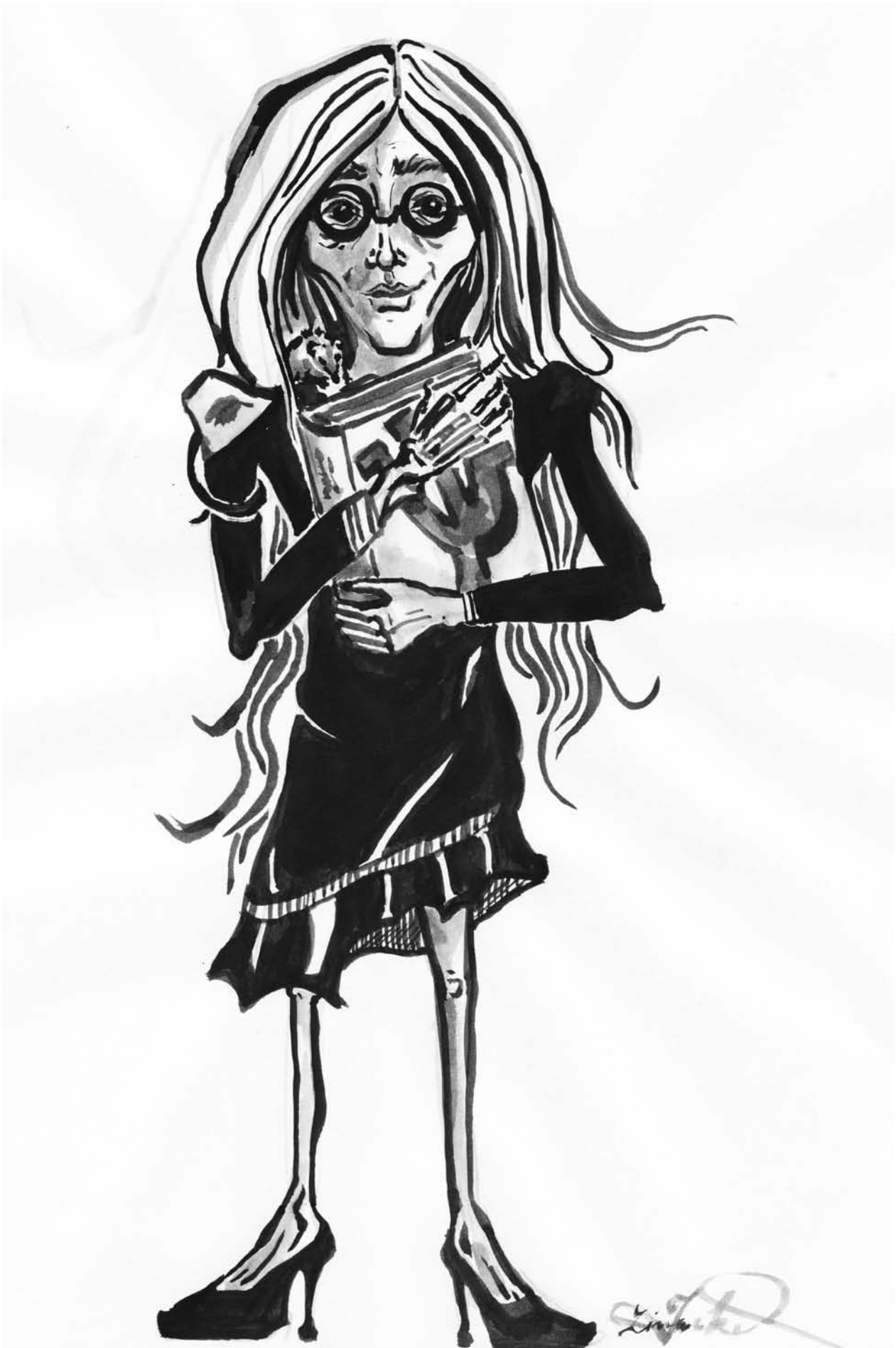
diese Woche: die Psychologiestudentin